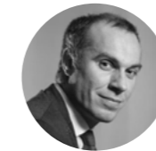
François Gemenne Auteur du GIEC The Hugo Observatory