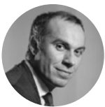
François Gemenne Auteur du GIEC The Hugo Observatory